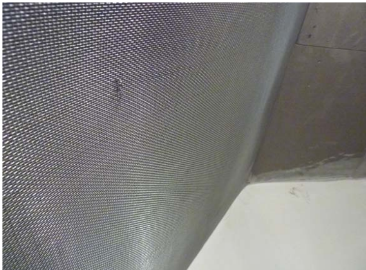
Metallnetzbekleidung an einer Dachschräge

Das Paar entschloss sich, den Schlafraum wie einen Faraday'schen Käfig mit einem geerdeten Metallnetz auszukleiden, um damit elektromagnetische Felder – landläufig „Elektrosmog“ genannt - abzuschirmen.