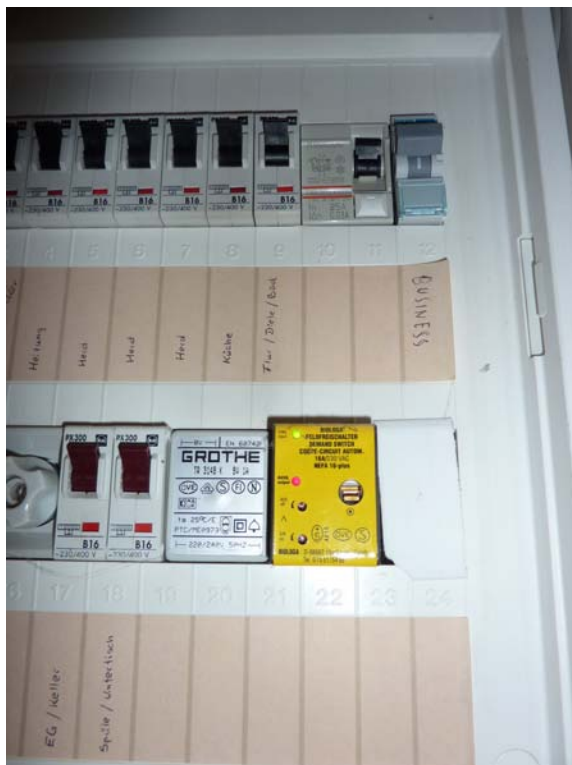
Netzfreischalter (gelbes Bauteil)

Ein Ehepaar im mittleren Lebensalter siedelte sich in einem neu gebauten Reihenhaus an. Es hatte dabei auch baubiologische Empfehlungen beherzigt. So war zum Beispiel ein Netzfreischalter in die Elektroverteilung eingebaut worden.