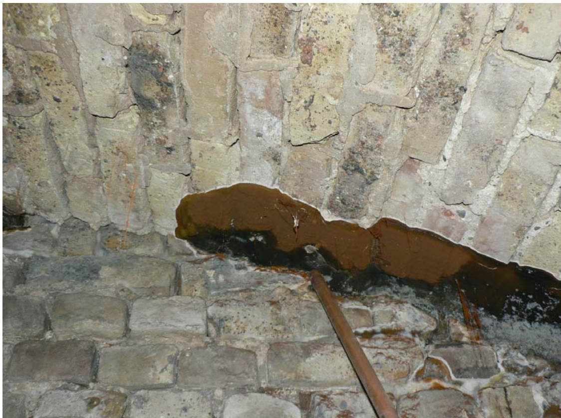
Fruchtkörper des echten Hausschwamm

Das Paar wunderte sich, aber es sollte noch dauern, bis sich eine Ahnung einstellte, dass hier die Ursache für Claudias Beschwerden herumlag. Die Quelle des Staubes war ein Gebilde an der feuchten Kellerwand, das von Woche zu Woche größer wurde.