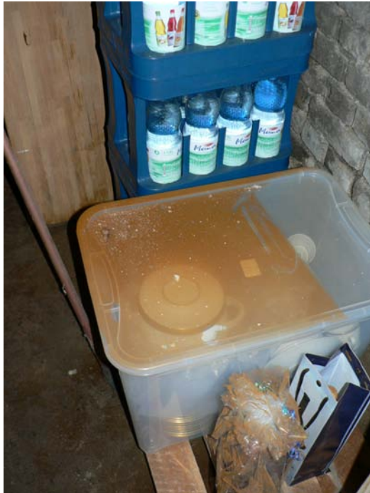
Sporenstaub des echten Hausschwamm

Im gleichen Zeitraum geschah im Keller des Hauses etwas Seltsames: in einem Kellerraum legte sich auf alle abgelegten Gegenstände ein feiner roter Staub.