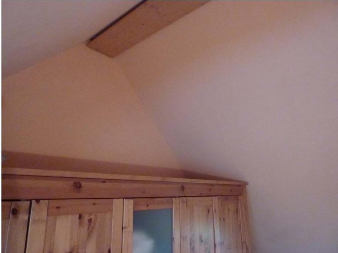
Das ansprechende neue Raumfinish über dem Metallnetz verrät nichts über die Schutzfunktion gegen E-Smog