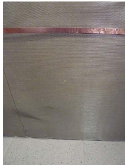
Metallnetz mit Erdungsband

Das war in diesem Fall aufwendiger als in anderen Fällen. Doch die Kontrollmessung des Gutachters bescheinigte eine 98%ige Verringerung der Feldstärke an Monikas Schlafplatz.