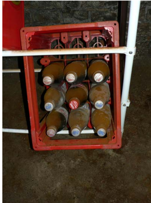
Sporenstaub des echten Hausschwamm

Das Paar wunderte sich, aber es sollte noch dauern, bis sich eine Ahnung einstellte, dass hier die Ursache für Claudias Beschwerden herumlag. Die Quelle des Staubes war ein Gebilde an der feuchten Kellerwand, das von Woche zu Woche größer wurde.